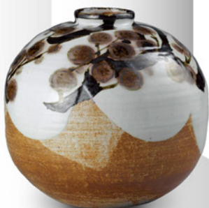
田村 耕一「紅梅文大壺」