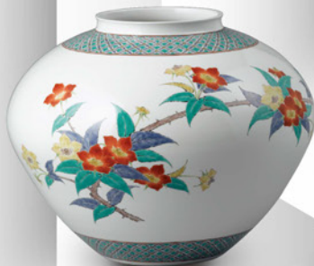
14代 酒井田 柿右衛門 「濁手莓花文花瓶」