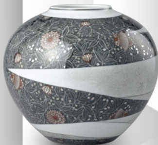
14代 今泉 今右衛門 「色絵墨色墨はじき草花更紗花瓶」