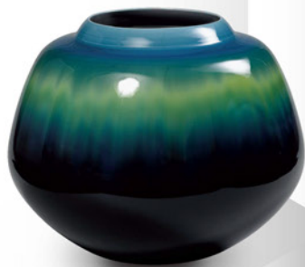
3代 徳田 八十吉 「碧明釉壺」