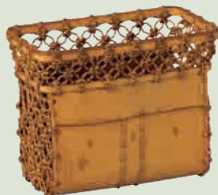
飯塚 琅玕齋「華籃 黄威」