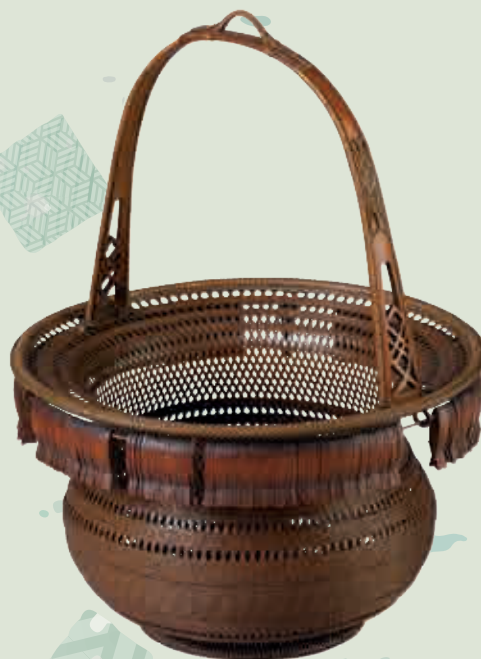
飯塚 琅玕齋「花籃 魚の舞」