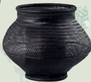
2代田辺 竹雲齋「四ツ目編 壺形花器」